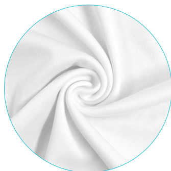
A | gładki, lekki poliester 130g/m 2