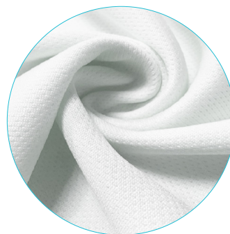
C | Coolmax® F02 lekki, szybko schnący poliester z perforacją w drobne oczka 130g/m 2