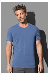
ST9600 Clive Crew Neck